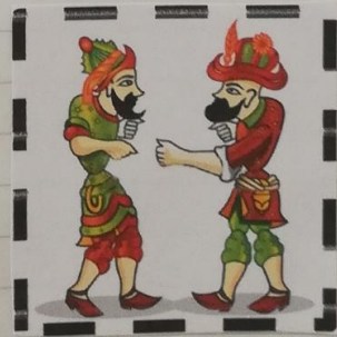
Hacıvat ile Karagöz