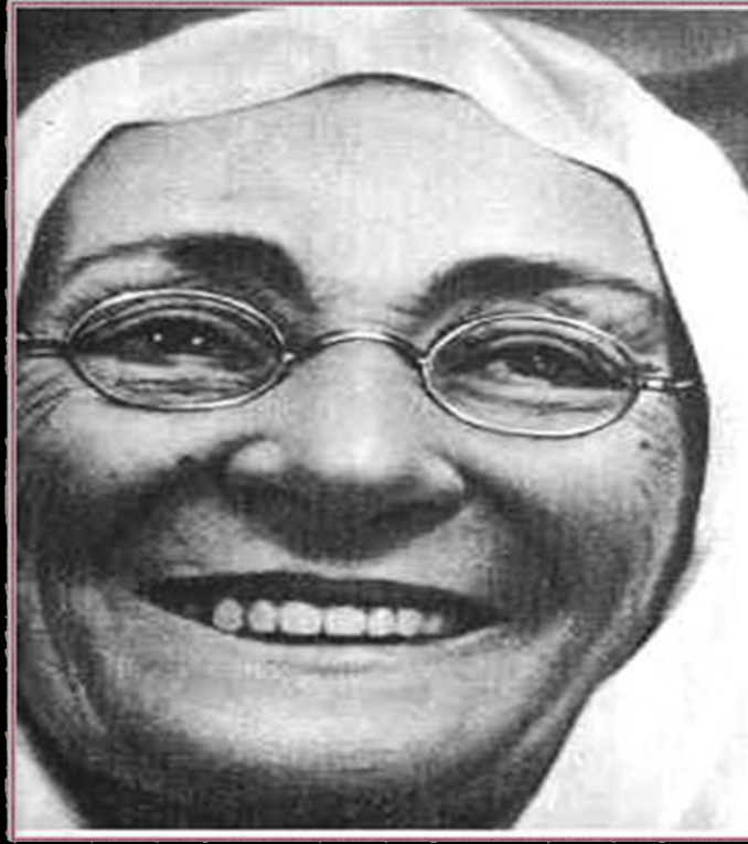
ATATÜRK'ÜN ANNESİ ZÜBEYDE HANIM.