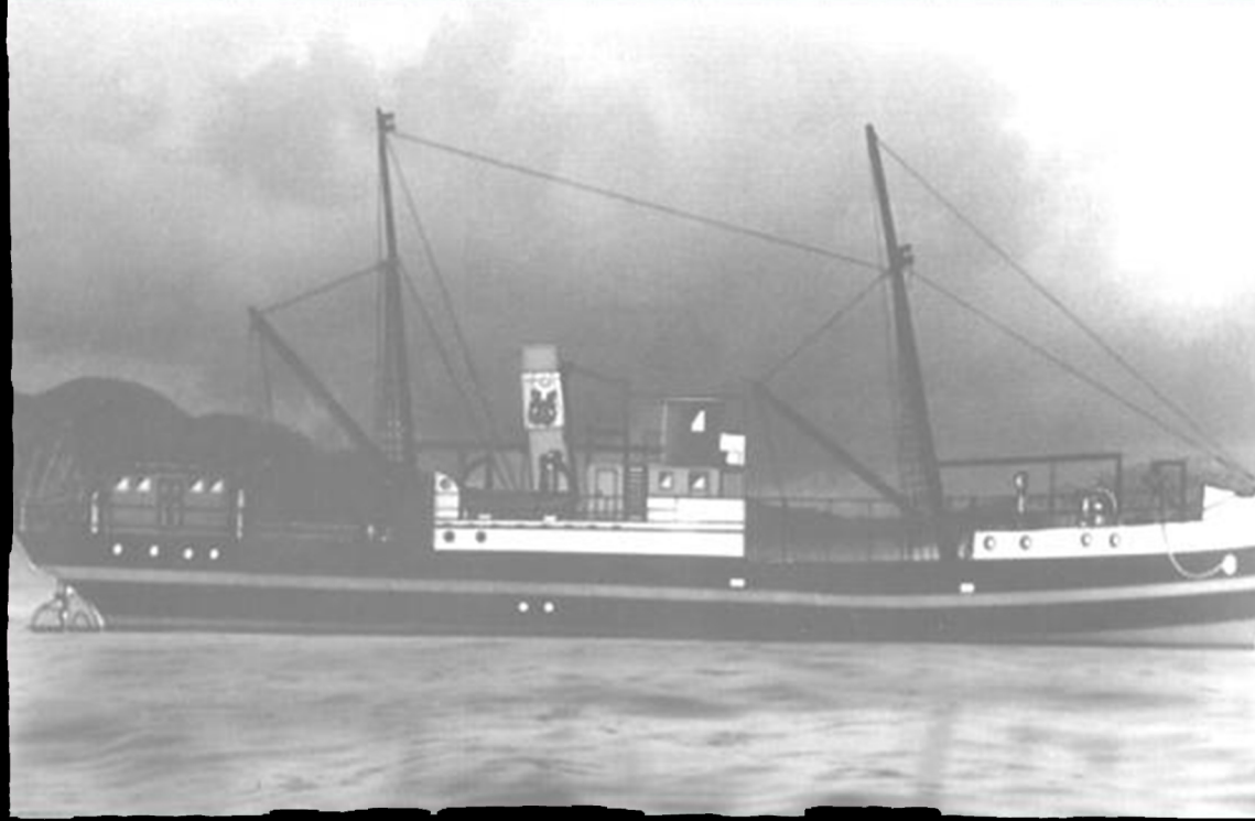
ATATÜRK'ÜN SAMSUN'A ÇIKTIĞI BANDIRMA VAPURU.