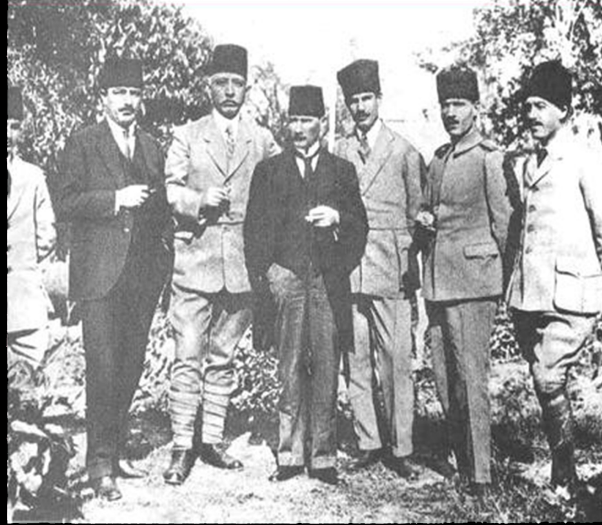
SİVAS KONGRESİ SIRASINDA SEÇİLEN HEYET-İ TEMSİLİYE ÜYELERİYLE. (4-11 EYLÜL 1919)