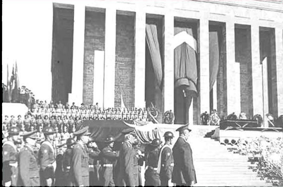
ATA'NIN AZİZ NAAŞ'I ANITKABİR'DEKİ EBEDİ İSTİRAHATGAHI'NDA. (10 KASIM 1953)