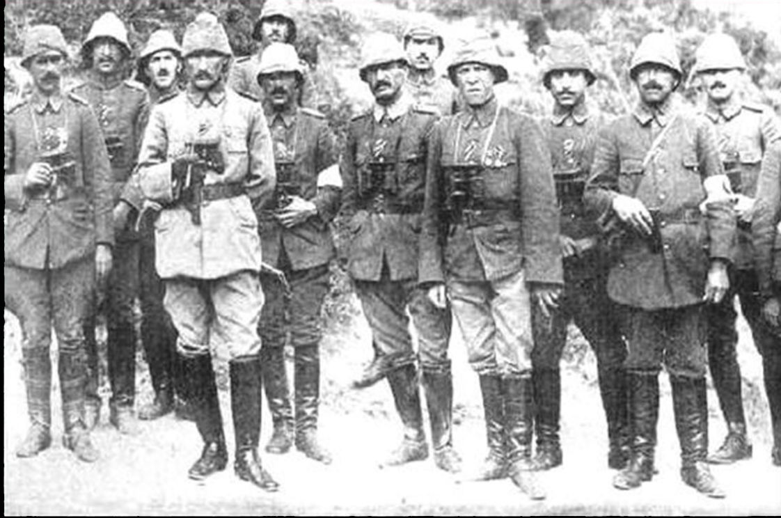
ANAFARTALAR GRUP KOMUTANI MUSTAFA KEMAL KARARGAHIYLA. (1915)