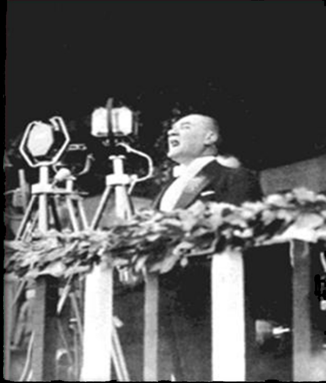
CUMHURİYET'İN ONUNCU YILINDA ANKARA HİPODROMUNDA ONUNCU YIL NUTKU'NU SÖYLERKEN. (29 EKİM 1933)