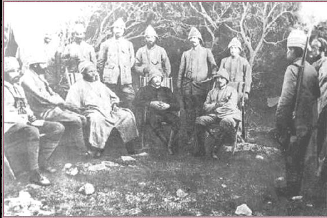
(TRABLUSGARP) DERNE'DE ARKADAŞLARI VE YERLİ SAVAŞÇILARLA. (1912)