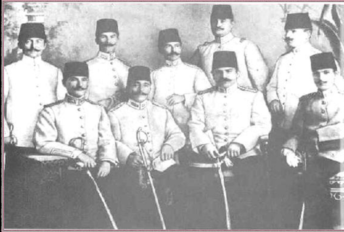
İSTANBUL YILDIZ HARP AKADEMİSİ'NDE ARKADAŞLARIYLA. (1902-1905)