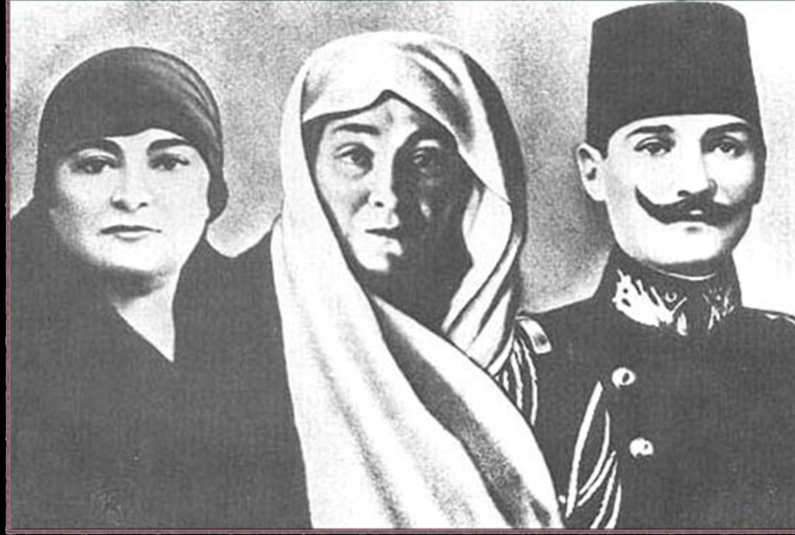
KIZ KARDEŐİ MAKBULE HANIM, ANNESİ ZÜBEYDE HANIM VE KURMAY YÜZBAŐI MUSTAFA KEMAL.