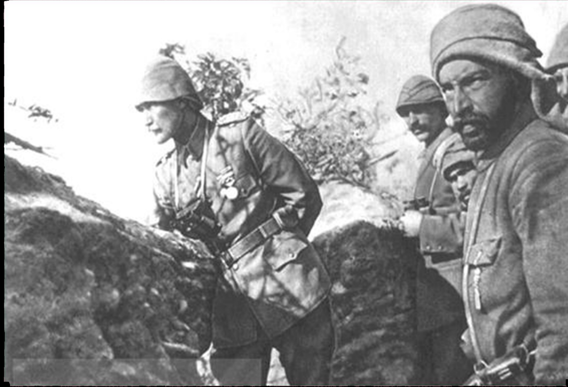
ANAFARTALAR GRUP KOMUTANI MUSTAFA KEMAL. (1915)