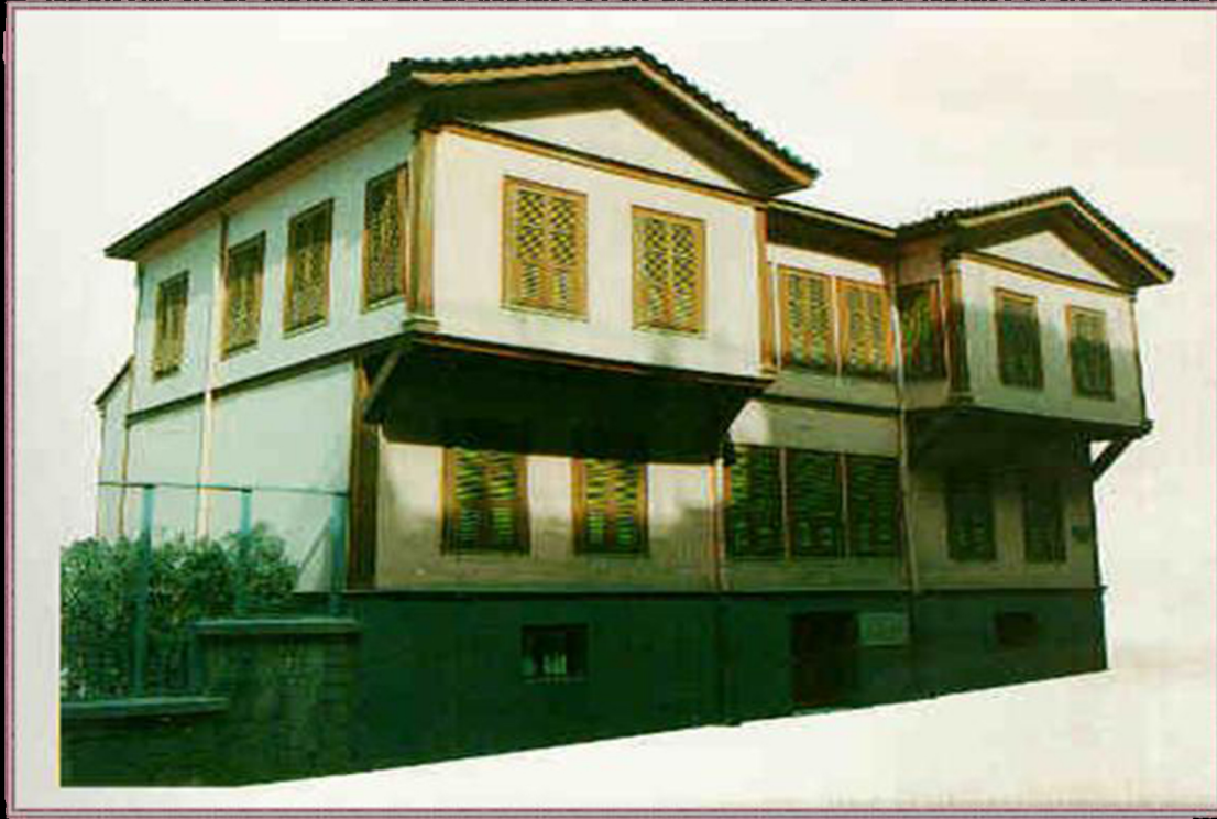
SELANİK KOCASINAN MAHALLESİ, ISLAHHANE CADDESİNDEKİ ATATÜRK'ÜN DOĞDUĞU ÜÇ KATLI EV.