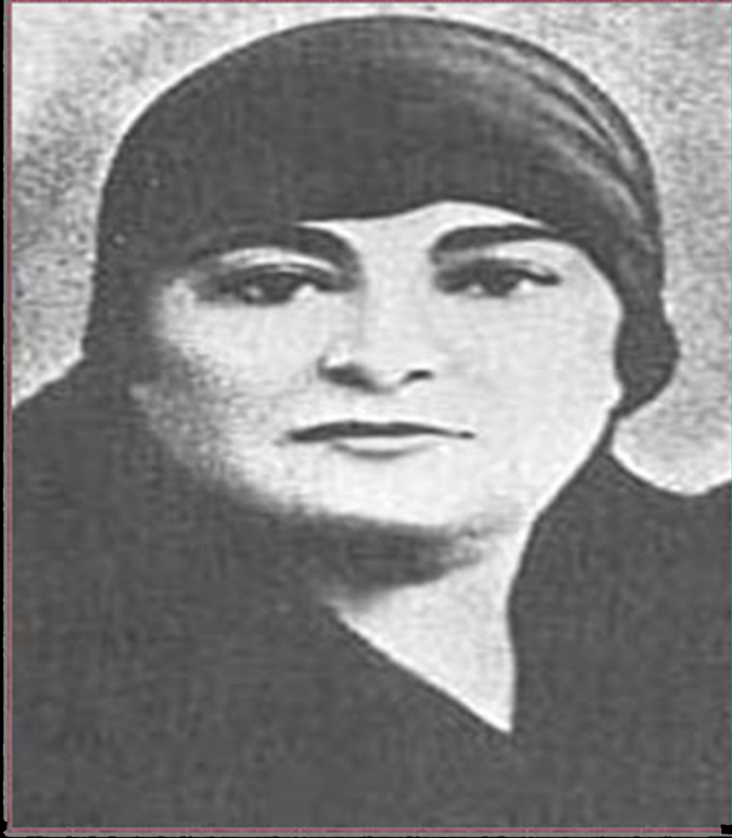
ATATÜRK'ÜN KIZ KARDEŞİ MAKBULE (ATADAN) HANIM.